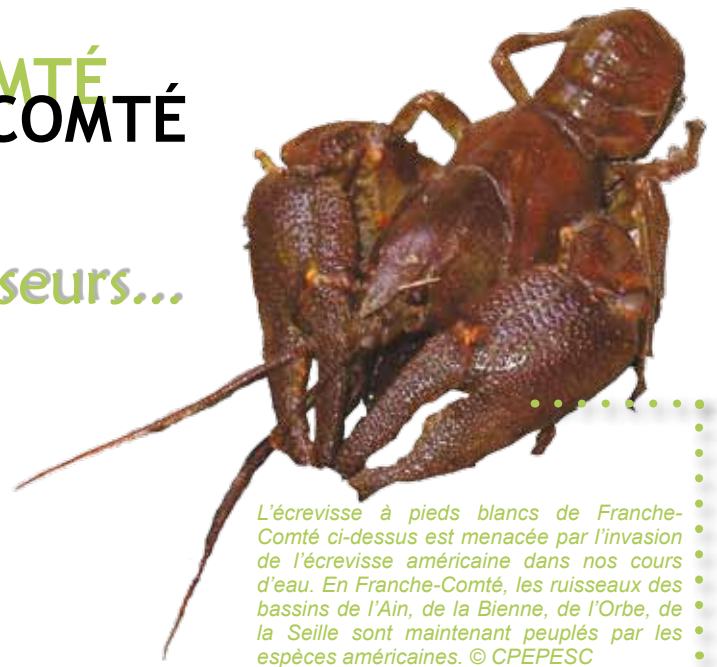
L'écrevisse à pieds blancs de Franche-Comté ci-dessus est menacée par l'invasion de l'écrevisse américaine dans nos cours d'eau. En Franche-Comté, les ruisseaux des bassins de l'Ain, de la Bienne, de l'Orbe, de la Seille sont maintenant peuplés par les espèces américaines.