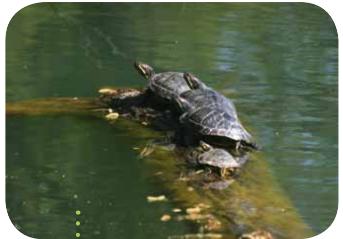
Tortues de Floride rencontrées à Roset-Fluans (25).

Nombreux sont les enfants qui ont voulu une tortue de Floride. Au début, sa petite taille la rend agréable. Avec le temps, elle grossit, mord ses propriétaires qui se demandent comment il faut la nourrir. Elle termine souvent son parcours domestique jetée dans un milieu aquatique tel un étang, une rivière où elle est régulièrement trouvée. Localement, la concurrence avec la cistude d'Europe n'existe plus