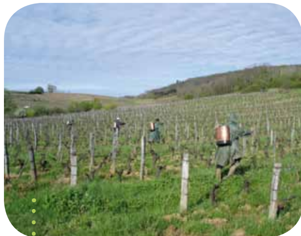
Application de préparation bio-dynamique sur le domaine de Bénédicte et Stéphane Tissot.

Les pratiques de bio-dynamie nécessitent de repenser complètement le contexte où nous vivons : la biosphère et l'homme ne sont pas