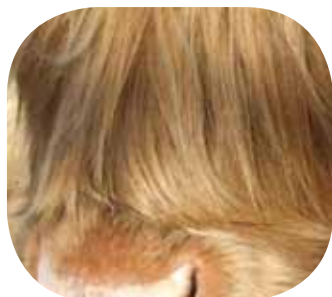
museau d'une vache Highland Cattle